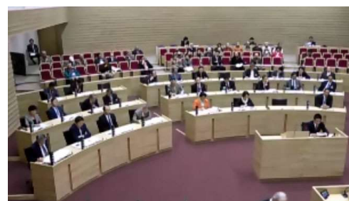
新しくなった議場

3月市議会の際、傍聴にお越しいただいた皆様、大変ありがとうございました。市役所を訪れる機会は少ないかもしれませんが、そのような機会にぜひお越しいただき、新しい庁舎をご利用、ご見学いただきたいと思います。