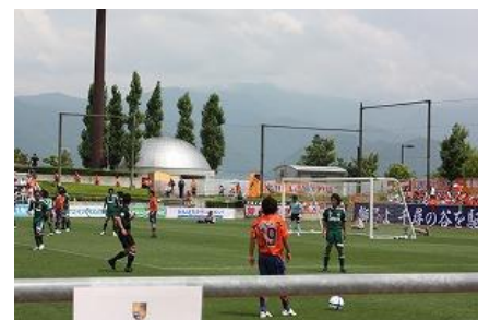
J2昇格を目指すAC長野パルセイロ

会派代表として、私が本議会で提案した「文化・スポーツ振興部」の市長部局への移管が、実現の方向となりました。 これまで教育委員会所管でしたが、芸術館の新設やJ2昇格を目指すAC長野パルセイロ支援など、教育委員会の枠を超え、部局横断、多様な施策対応が期待されます。