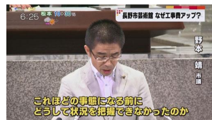
SBC ニュースでも取り上げられました

⇒全国的な労務不足が見通せず、約8か月の遅れになったことは、市側からお詫びがありました。長野駅前改良工事、南長野運動公園などの工事は順調であるのに比べ、新庁舎・芸術館は特殊工事が多いことも遅れに影響しています。 今後は、進捗管理の徹底と、現場で働く皆さんの士気が落ちないよう、十分監督していただきたい旨お願いいたしました。