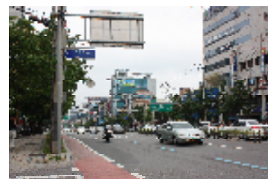
西大邱は人口250万人、韓国第3の都市。

国レベルでは様々な問題がありますが、そんな時こそ、民間レベルでの交流を続けていくことはとても大切だと感じました。